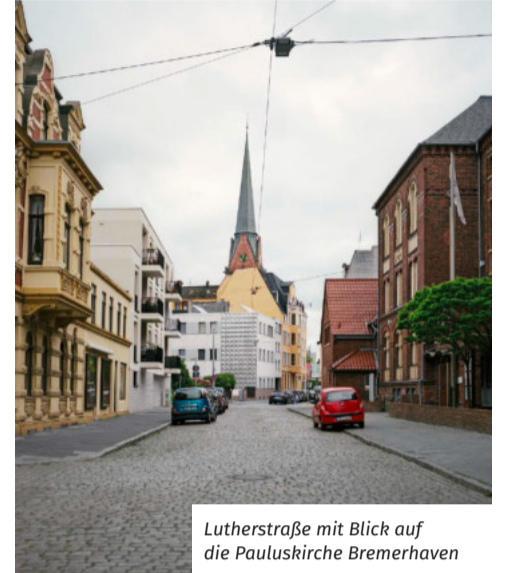
Lutherstraße mit Blick auf die Pauluskirche Bremerhaven

Die Ausstellung mit allen Fotografien aus dem Buch läuft noch bis zum