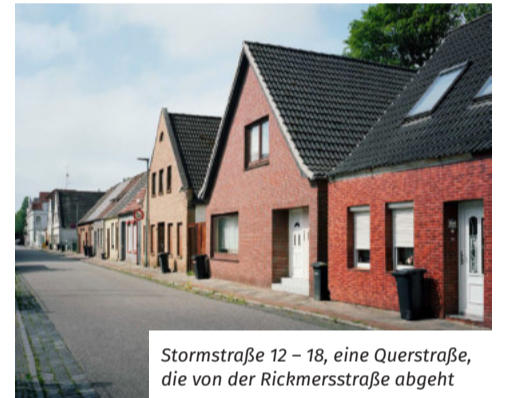
Stormstraße 12 – 18, eine Querstraße, die von der Rickmersstraße abgeht