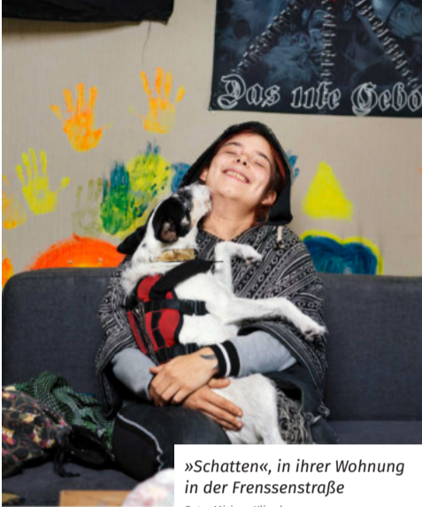
»Schatten«, in ihrer Wohnung in der Frenssenstraße

„Ich spaziere hier seit zwei Jahren jeden Sonntag lang. Warum hab' ich jetzt erst damit angefangen?“