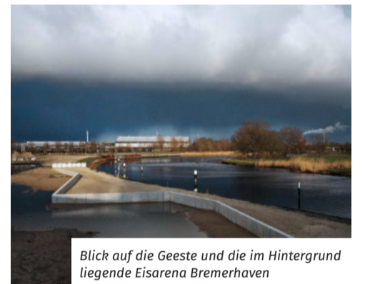
Blick auf die Geeste und die im Hintergrund liegende Eisarena Bremerhaven

17.06. und ist in der in der Hinrich-Schmalfeldtstr. 29 zu finden.