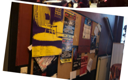
Egal ob musikalisch, sportlich oder mit Blick in die Zukunft: Der Kulturbahnhof Lehe